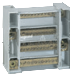
0 048 77