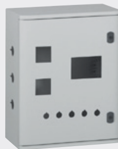
Coffret Marina percé en usine

Réalisation de perçages sur toutes les parties du coffret, porte interne, plaques pleines, pour kit de jumelage... Plans de perçage à fournir (format pdf, dxf, ...)