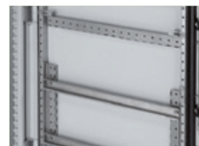
0 477 19/20/21