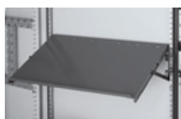
0 477 08