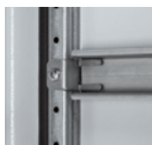
0 477 18 + 0 477 16