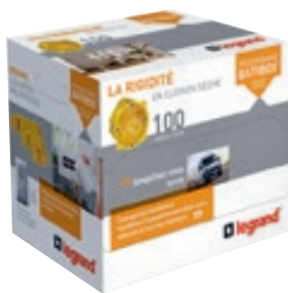
0 800 08