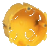
0 893 58