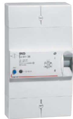
4 011 38