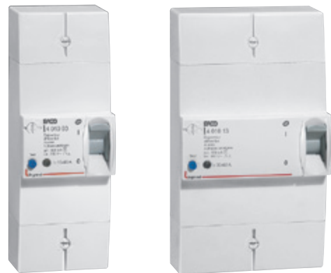
4 010 03