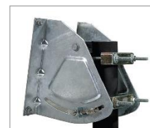
Pièce arrière AZ/EL