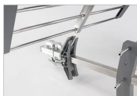
Système CLIC CLAC Montage facile

Dipôle clipable sur la structure Clip renforcé pour une meilleur tenue