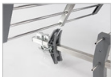
Système CLIC CLAC Montage facile