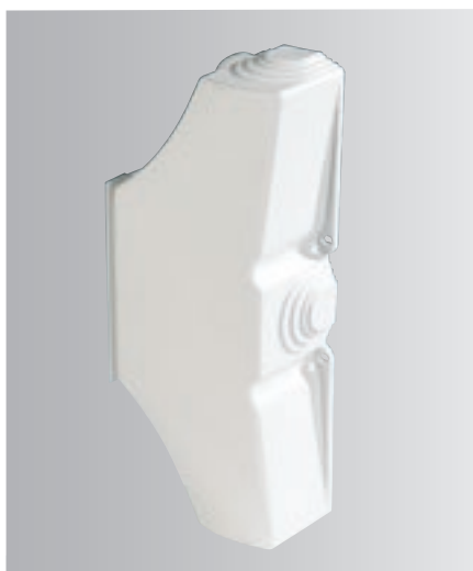
Cornet d'épanouissement latéral court 3 directions