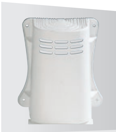
Cornet d'épanouissement long