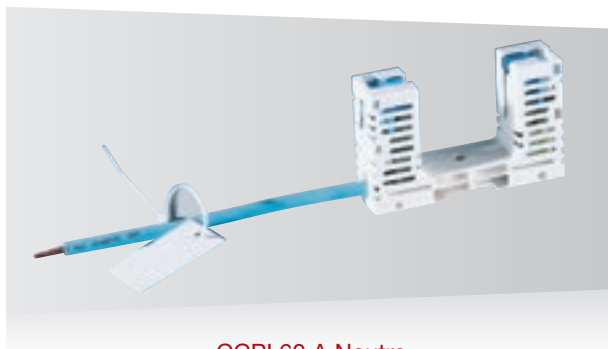
CCPI 60 A Neutre

La manœuvre du fusible ou de la barrette de sectionnement se fait par poignée normalisée.