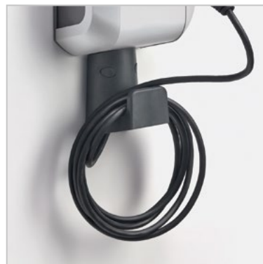
Support pour câble de recharge Réf. 13P2750322