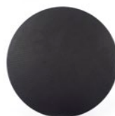
grille noire (option)