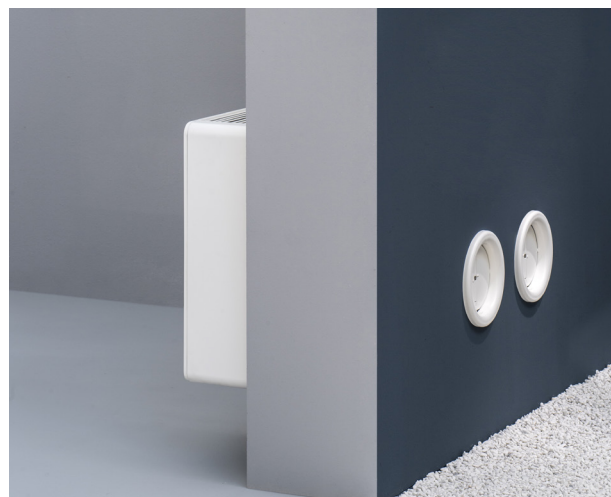
Montage de démonstration, les 2 trous doivent donner sur l'extérieur.

Soloclim peut être installé sur tout type de mur, en hauteur (version murale) ou au sol (version allège). Les accessoires nécessaires pour l'installation (gabarit d'installation, support de montage, traverses de mur, grilles extérieures) sont fournis avec le produit. Un kit lateral, à commander séparément, permet de mettre les grilles de sortie sur le côté. Pour une installation en hauteur, une sous-face est disponible en option.