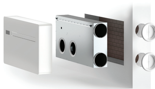
Soloclim muni d'un kit lateral.