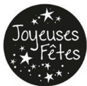
Illustration de votre choix jusqu'à 4 couleurs ( nous fournir l'illustration dans un format numérique vectoriel).

* ACCESSOIRES : Gobos en verre (1C / 2C / 3C / 4C ), autres modèles disponibles nous contacter.