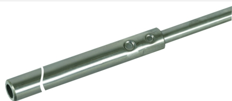
Illustrations sans engagement