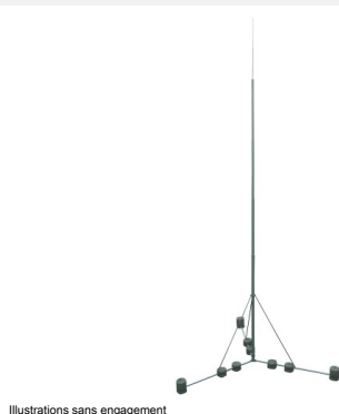
Illustrations sans engagement