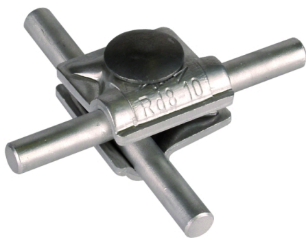
Illustrations sans engagement