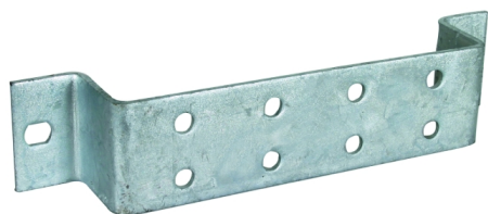
Illustrations sans engagement