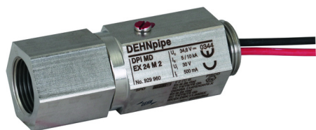
Illustrations sans engagement