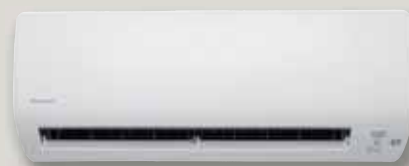
CTXS-K / FTXS-K