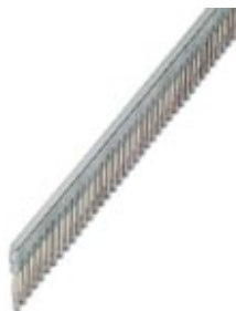
Pont enfichable, Dimension pas: 5,2 mm, Nombre de pôles: 50, Coloris: gris

Remarque : les données indiquées ici sont tirées du catalogue en ligne. Vous trouverez toutes les informations et données dans la documentation utilisateur. Les conditions générales d'utilisation pour les téléchargements sur Internet sont applicables. ( http://phoenixcontact.fr/download )