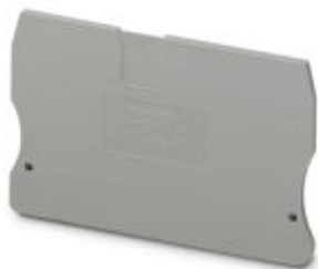
Flasque d'extrémité, Longueur: 71,5 mm, Largeur: 2,2 mm, Hauteur: 49,9 mm, Coloris: gris

Remarque : les données indiquées ici sont tirées du catalogue en ligne. Vous trouverez toutes les informations et données dans la documentation utilisateur. Les conditions générales d'utilisation pour les téléchargements sur Internet sont applicables. ( http://phoenixcontact.fr/download )