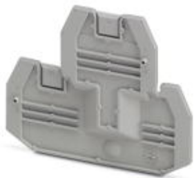
Flasque d'extrémité, Longueur: 69,9 mm, Largeur: 2,2 mm, Hauteur: 57,5 mm, Coloris: gris

Remarque : les données indiquées ici sont tirées du catalogue en ligne. Vous trouverez toutes les informations et données dans la documentation utilisateur. Les conditions générales d'utilisation pour les téléchargements sur Internet sont applicables. ( http://phoenixcontact.fr/download )