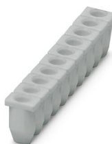
Manchon isolant, coloris: gris

https://www.phoenixcontact.com/fr/produits/3031034