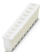
Manchon isolant, coloris: blanc

https://www.phoenixcontact.com/fr/produits/3206131