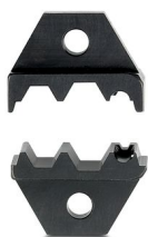
Matrice de rechange pour CRIMPFOX-CX 6,48

https://www.phoenixcontact.com/fr/produits/1212286