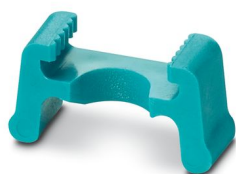
Butée de rechange

https://www.phoenixcontact.com/fr/produits/1212370