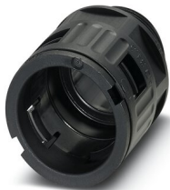
Presse-étoupe, filetage métrique, indice de protection IP66, droit

https://www.phoenixcontact.com/fr/produits/3240900