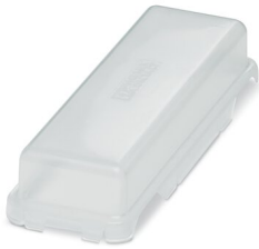
Capot de protection, type: B24

https://www.phoenixcontact.com/fr/produits/1421103