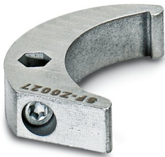
Clé à ergot, série: RC

https://www.phoenixcontact.com/fr/produits/1607455