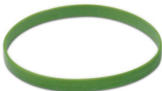
Détrompage couleur, coloris: vert

https://www.phoenixcontact.com/fr/produits/1620588