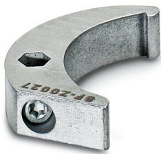
Clé à ergot, série: RC

https://www.phoenixcontact.com/fr/produits/1607455