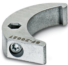
Clé à ergot, série: RC

https://www.phoenixcontact.com/fr/produits/1607455