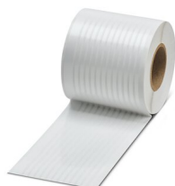
Bandes de repérage, Rouleau, blanc, vierge, repérable avec : THERMOMARK E.300 (D)/600 (D), THERMOMARK ROLL 2.0, THERMOMARK ROLL, THERMOMARK ROLL X1, THERMOMARK ROLLMaster 300/600, THERMOMARK X1.2, type de montage: collage, surface utile: sans fin x 3,8 mm

https://www.phoenixcontact.com/fr/produits/0801837