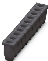
Manchon isolant, coloris: noir

https://www.phoenixcontact.com/fr/produits/3002869