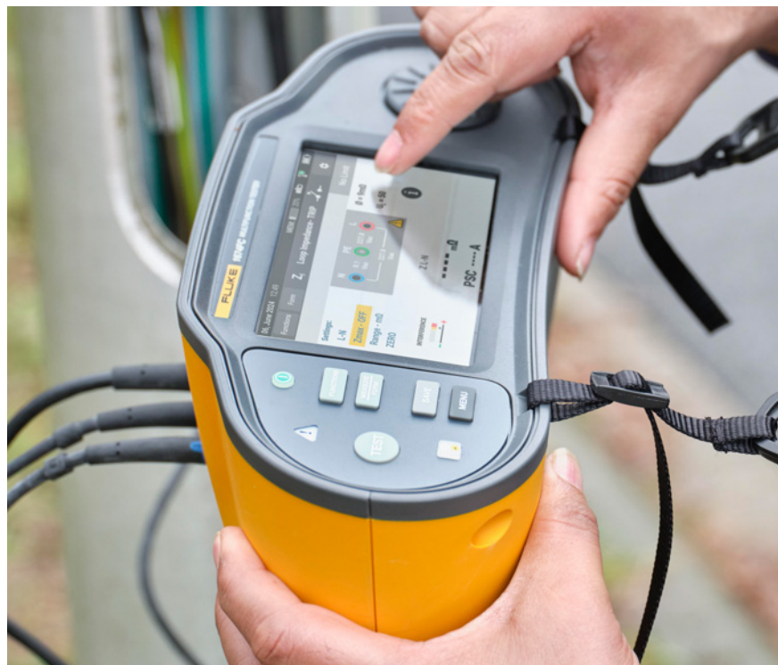
Ecran tactile couleur et sélecteur rotatif tactile pour une navigation rapide

Simplifiez la génération de rapports grâce à la saisie automatique des rapports, l'intégration de Fluke Connect et à la création de rapports par simple pression d'un bouton avec le logiciel Fluke TruTest™.