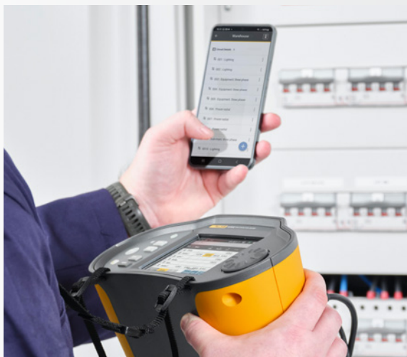
Réduisez la saisie manuelle des données et l'archivage