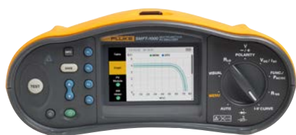
Enregistrer des données