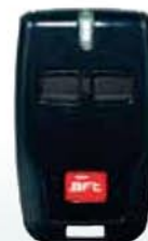
Emetteur 2 canaux