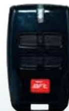
Emetteur 4 canaux