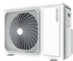
1U 012 et 018 DBR