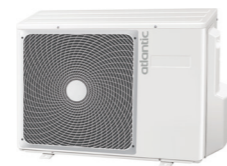
1U 009 DBR