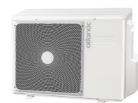
1U 007 DBR