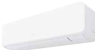
Version Confort - Grandes Puissances