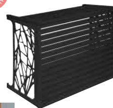
Gamme Confort couleur gris anthracite