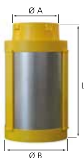
PAS 125 DF

PAS 125 DF : piège à sons spécial pour limiter le bruit rayonné (lot de 2), raccordement mâle/femelle.