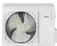
TU 048 DB