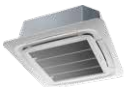
AB 048 DB