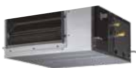
ARXG 12 et 14 KHTAP