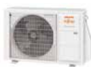
AOYG 12 et 14 KBTB