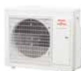
AOYG 30 KBTB monophasé