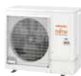
AOYG 36 KBTB monophasé