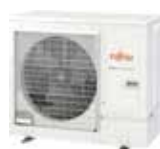
AOYG 36 KRTA triphasé