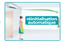
Retour au mode confort

Pour s'adapter au mieux au rythme de vie, il est possible de programmer des plages de fonctionnement , ainsi vous optimisez le fonctionnement de la pompe à chaleur Air/Air et affinez la consommation d'énergie .