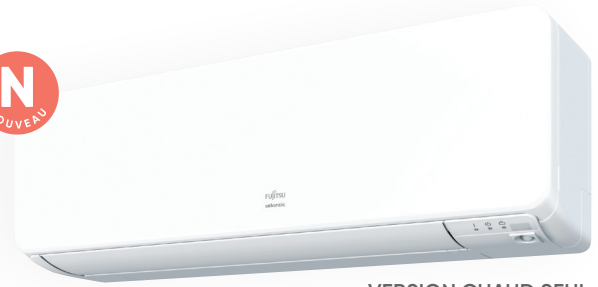
VERSION CHAUD SEUL SELON MODÈLE