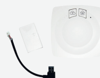
Pack Naviclim pour l'utilisation de l'application Cozytouch.

L'installation de ces télécommandes filaires nécessite la pose de la platine interface positionnée dans l'unité intérieure.