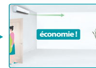
Passage en mode éco