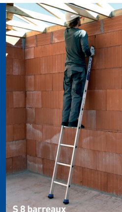
S 8 barreaux