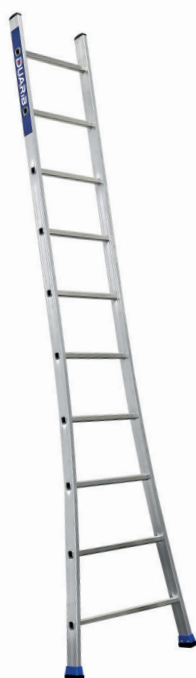
SE 10 barreaux