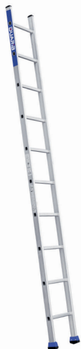
S 10 barreaux