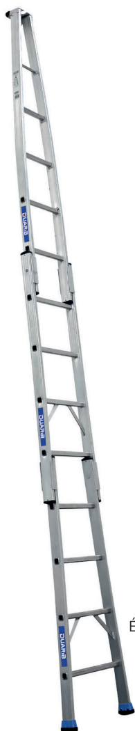
Échelle N 3 éléments