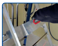
Plancher équipé d'une poignée pour faciliter l'ouverture et le repliage