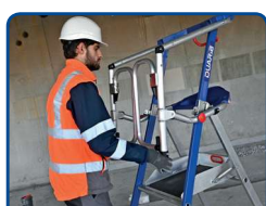
Mise en place du garde-corps en un seul geste