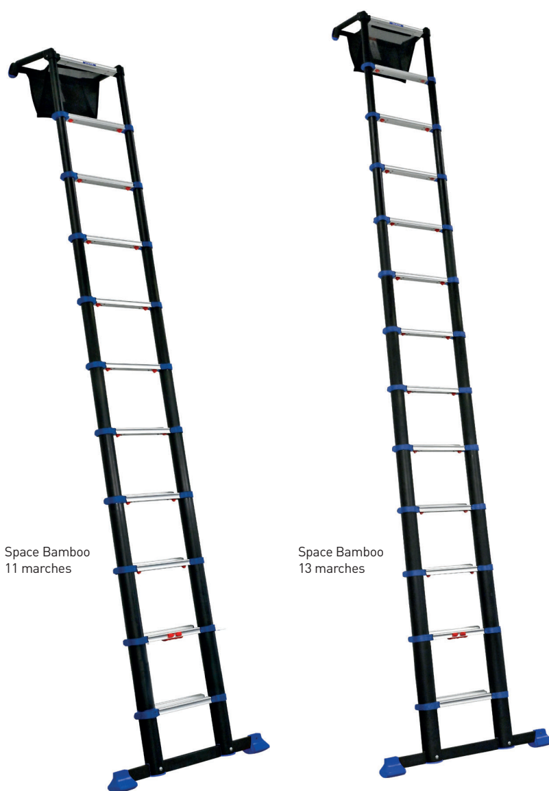
Space Bamboo 11 marches