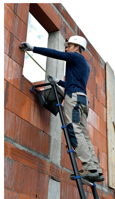
Space Bamboo 13 marches