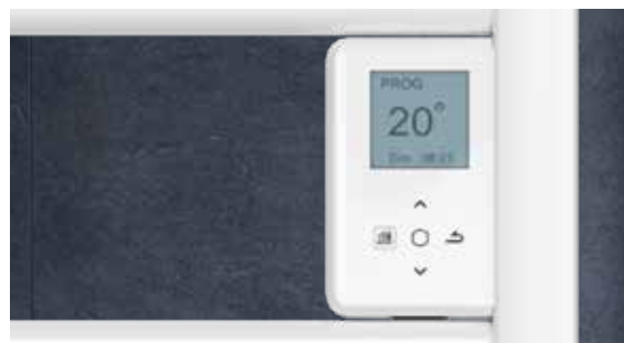
Boîtier digital tactile et programmable