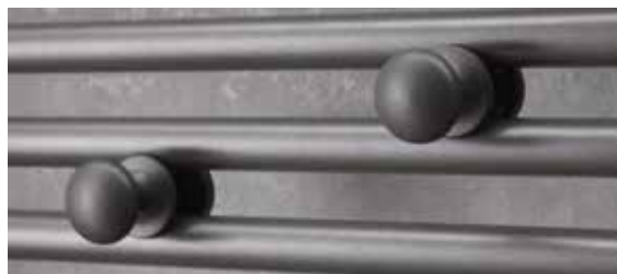
2 patères boutons amovibles