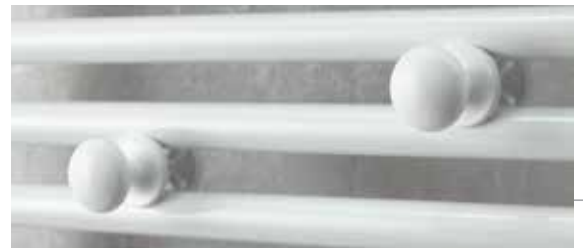
2 patères boutons amovibles