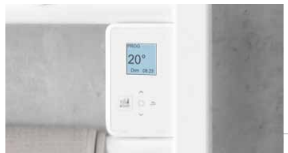
Boîtier digital tactile et programmable