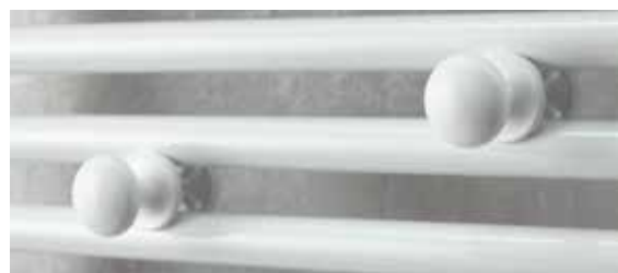
2 patères boutons amovibles