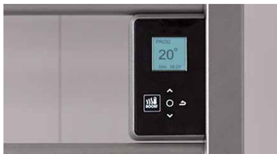
Boîtier digital tactile et programmable