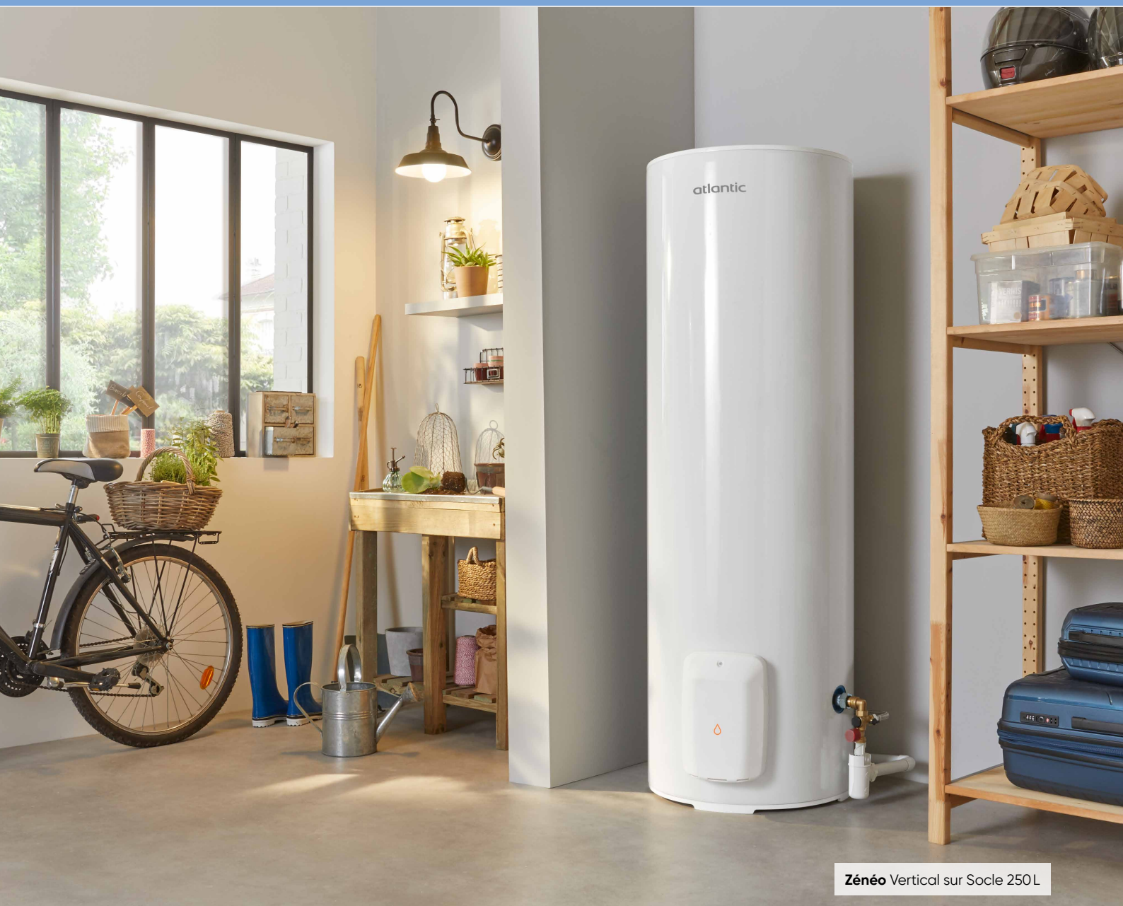
Zénéo Vertical sur Socle 250L