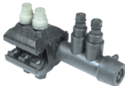
TTDR 88 F2A