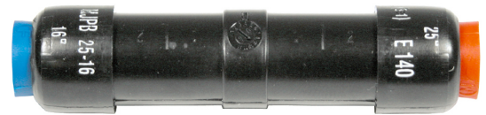
MJPB 25-16 CG

Mise en oeuvre : sertissage par rétreint hexagonal avec matrice E140.