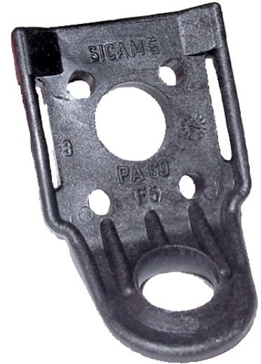
PA 69 F

Fixation par boulon Ø 16 mm ou feuillard (20 mm) ou 4 vis Ø 4 mm.