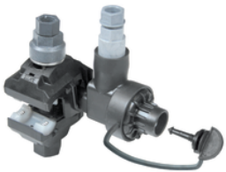
NTD 50-35 AFA